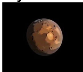
В Планета Марс